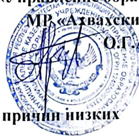
График проведения семинаров по выявлению причин низких образовательных результатов

«Утверждаю»: Врио начальника МКУ «Управление образования» МР «Ахвахский район» О.Г.Абдуласв